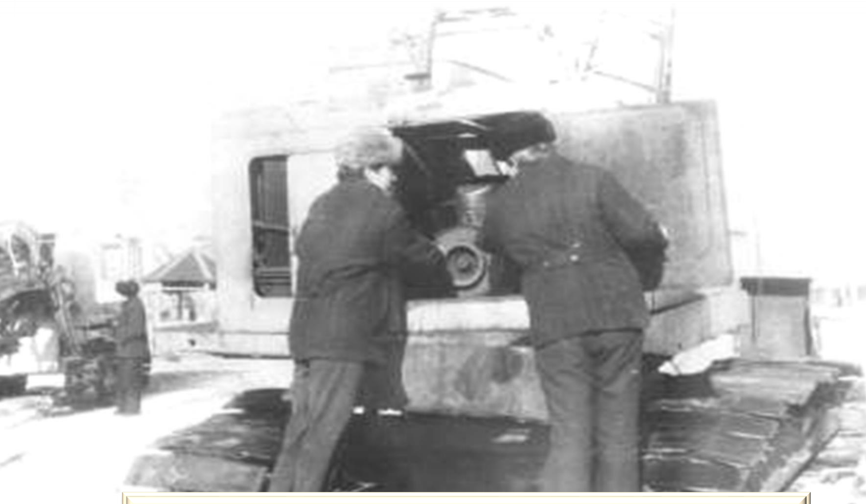
Проведение технического обслуживания экскаватора, 1977г.