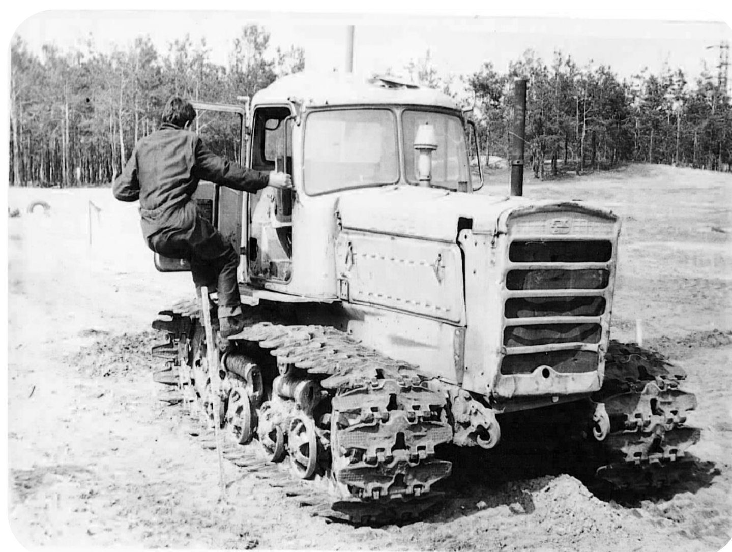
Конкурс по управлению трактором среди учащихся училища