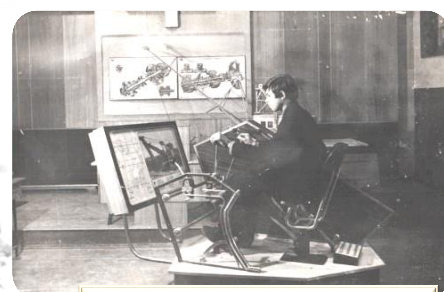
Отработка навыков работы на тренажере экскаватора

Директора колледжа в разное время играли ключевую роль в истории, внося значительный вклад в развитие учреждения образования. Их деятельность включает стратегическое планирование, обеспечение высокого качества образования и поддержание стандартов учебного процесса, а так же управление всеми аспектами работы учебного заведения.