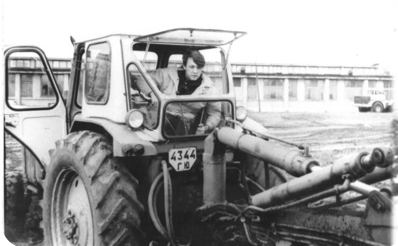
Отработка навыков работы на экскаваторе