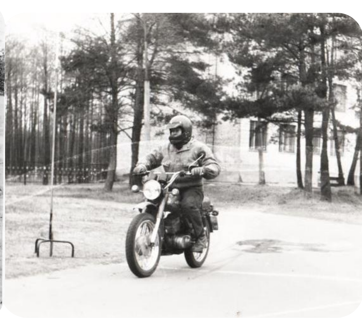
Занятия кружка по мотокроссу 80-е годы

В 1985 году был открыт второй учебный корпус.