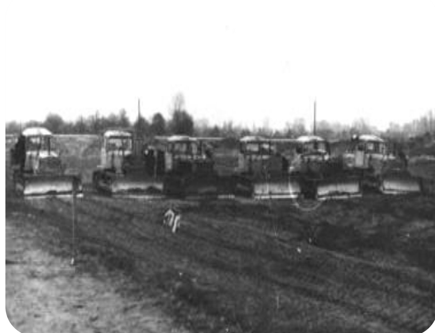
Мелиоративные работы при проведении производственного обучения